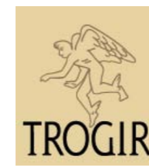
TURISTIČKA ZAJEDNICA GRADA TROGIRA