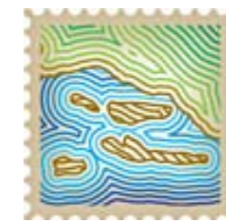
TURISTIČKA ZAJEDNICA SPLITSKO - DALMATINSKE ŽUPANIJE